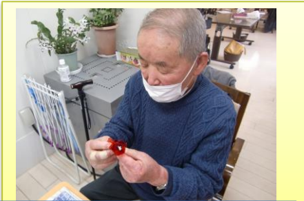
ご家族の為にコースージュを作っています(^_^)☆