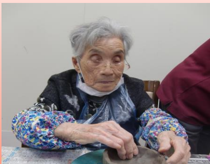
初めて陶芸に取り組みました！！ 真剣な顔をしています(*^-^*)