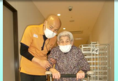
やる気十分！！歩行練習に励んでいます！！