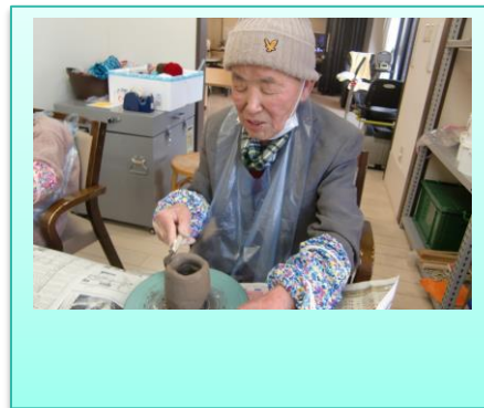
陶芸で湯飲みを作成中(^_-)☆難しいけど楽しい！！