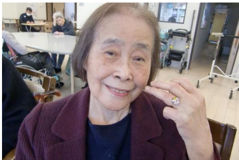
レジン細工で指輪を作りましたよ～ 手芸大好きです(*^-^*)