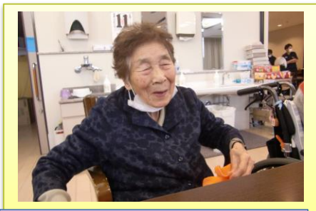
タオルを畳んでくれています(^_-)☆