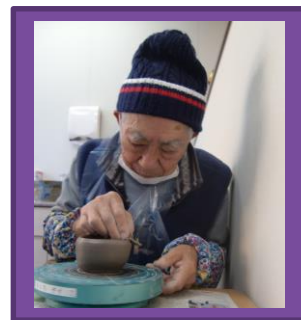
右：集中しています(^_-)☆