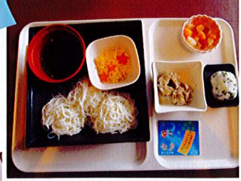
七夕そうめん & たなばたゼリー

7.8月の入居者さまの暮らしの様子をお届けします コロナ禍においての注意事項に配慮し 楽しんで頂きました