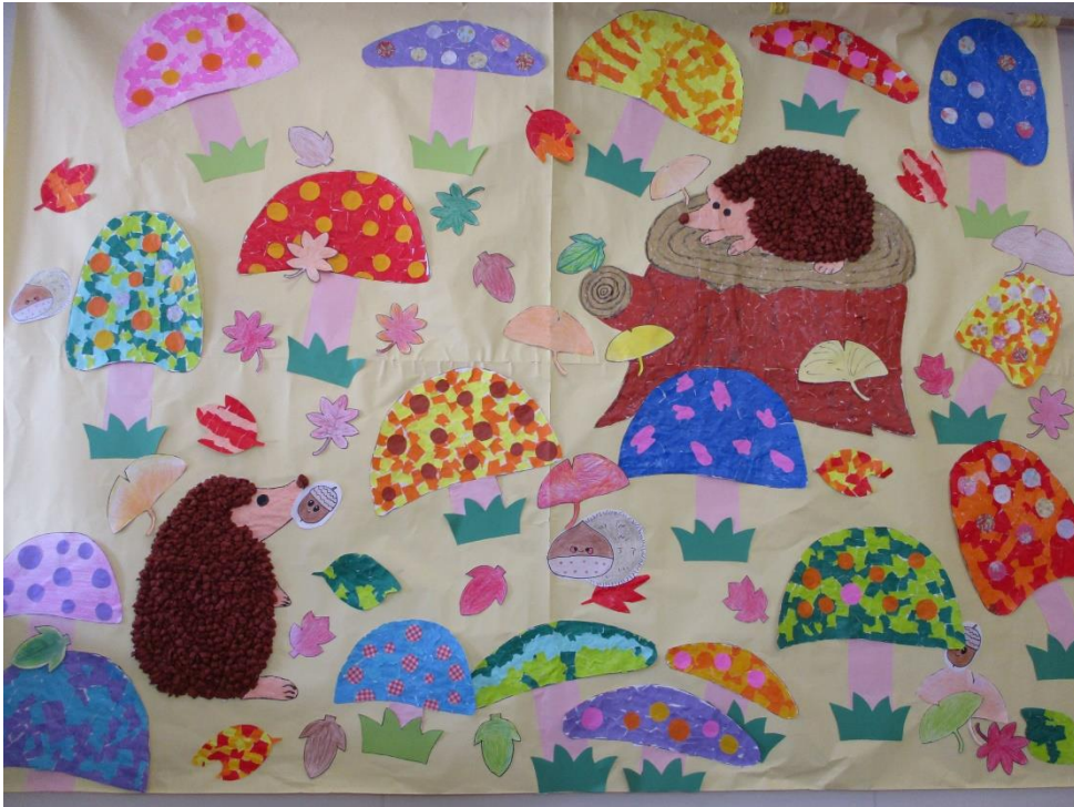
春らしい壁紙が出来ました(*^-へ^-*)